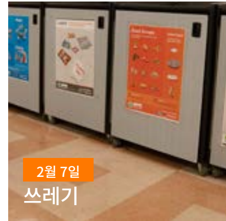
2월 7일 쓰레기