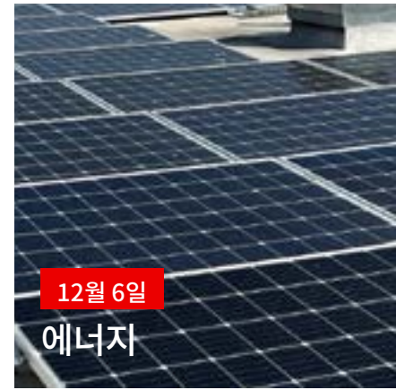
12월 6일 에너지